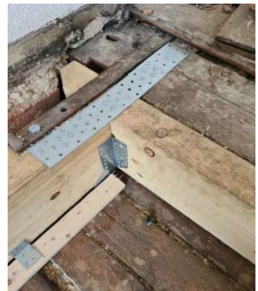
Fixierung und Verstärkung der Holzbalken durch Achsen und Stahlprofil