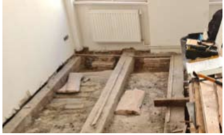
Balken zunächst stark geschädigt