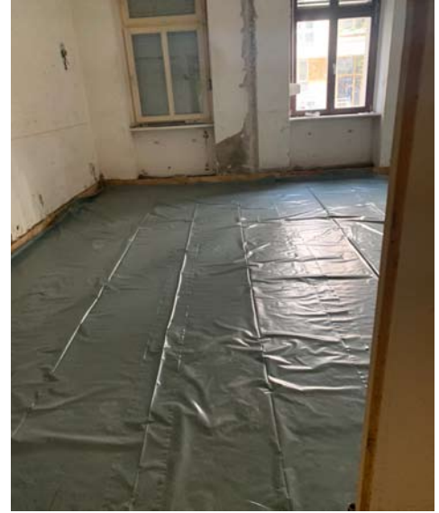
nach Abschluss der Holzbalkensanierung