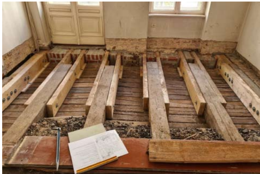
Verlegen von alten und neuen Dielenböden